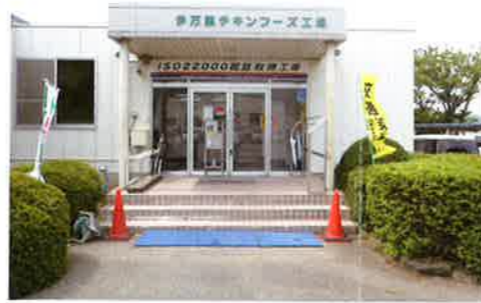
伊万里チキンフーズ工場